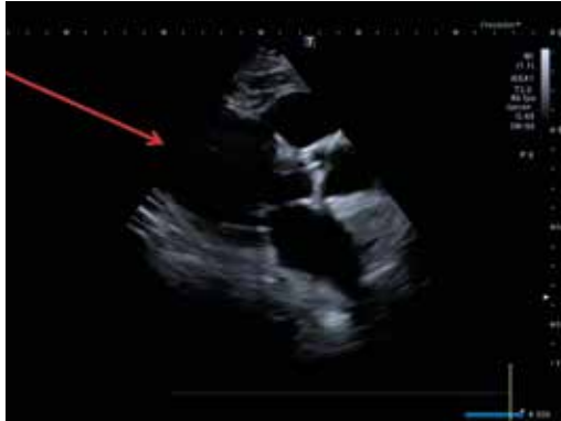
Parasternal long-axis view: AV = Aortic valve in systole.

G.D., 34 anni, HoFH, affetto da stenosi aortica severa.