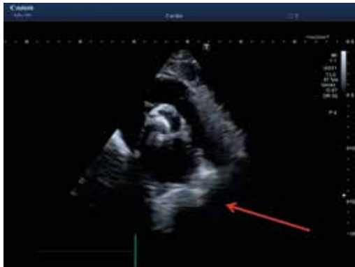
Parasternal short-axis view: AV = Aortic valve in systole.